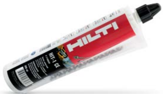
KLEBEANKER 300 ML